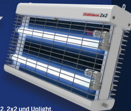
Entwickelt für den effektiven Einsatz mit den Modellen Chameleon® 1x2, 2x2 und Uplight.